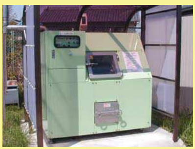
社会就労センター (DN-15)